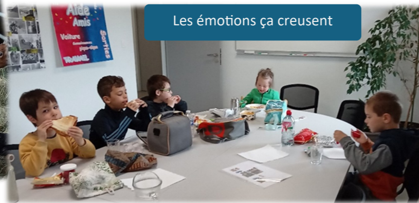
Les émotions ça creusent